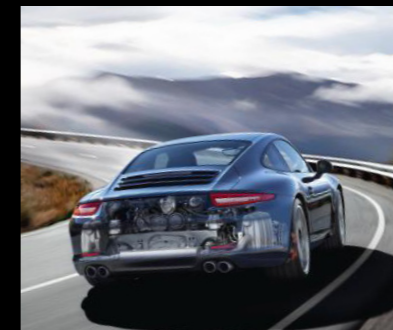
Entrega Dinámica Porsche: Porsche 'de tu a tu'.